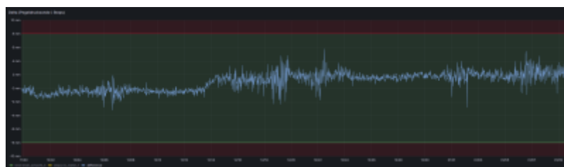
Fig. 2: Delta zwischen Pegeldrucksonde und dem EC-Messstand

Ein Vergleich mit dem EC-Messstand zeigt geringe Abweichungen, welche jedoch im Rahmen der angegebenen Genauigkeit des Sensors (0.5% FS) liegen: