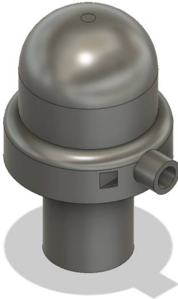
Fig. 11: Kappe

From: https://wiki.eolab.de/ - HSRW EOLab Wiki