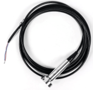
Fig. 2: Pegeldrucksonde