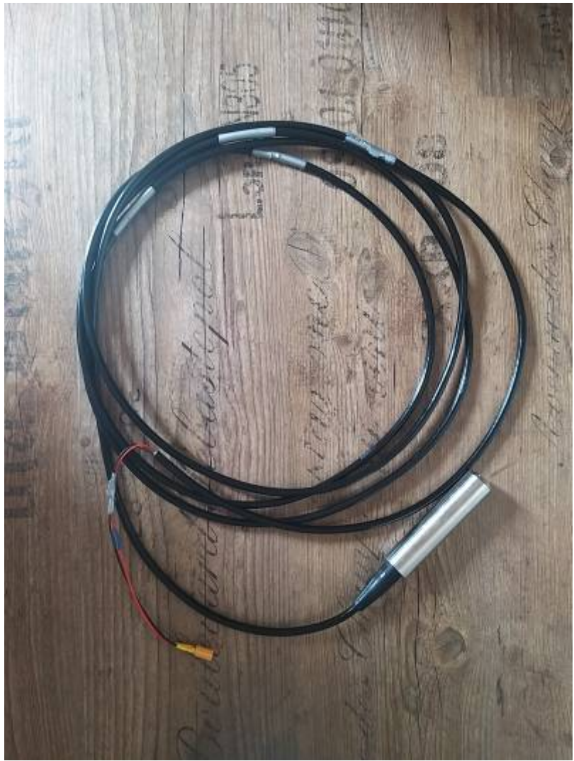
Fig. 8: Prototyp 1-Sonde

Die Sonde kann bis zu einer Tiefe von Metern messen. Die Hardware ist aber auch kompatibel zu anderen Längen. Lediglich die Berechnung vom analogen Signal, hin zu einer Tiefe in cm müsste angepasst werden. Die Klebebandmarkierungen wurden genutzt um den Sensor zu Evaluieren. Jede Markierung entspricht einer Tiefe in 1 Meter Schritten. So haben erste Tests gezeigt, dass der Sensor durchaus linear reagiert.