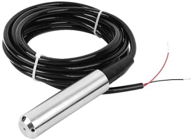
Fig. 2: Pegeldurcksonde

Diese Art von Sensoren wird meist über die Stromschnittstelle "4 .. 20mA" betrieben. Dabei muss die Node den Strom messen, welcher der Sensor verbraucht. Dieser liegt dann zwischen 4mA und 20mA. Der Messbereich des Sensors muss dann auf den Bereich 4mA bis 20mA übertragen werden. Ist der Messbereich des Sensors bspw. mit 0m bis 100m angegeben, würde bei einer 0m Messung 4mA an Strom fließen und bei 100m 20mA.