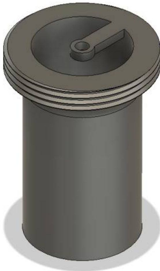
Fig. 10: Inlay

Weiterhin wurde auch ein Gehäuse für die Technik designed.