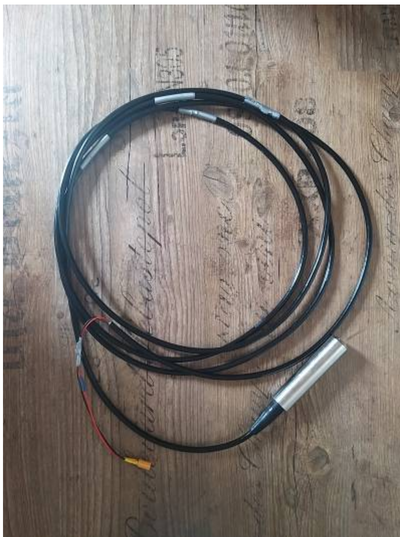
Fig. 8: Prototyp 1-Sonde

Der Aufbau ist bewusst einfach und modular gestaltet um im Notfall Komponenten schnell auswechseln zu können.