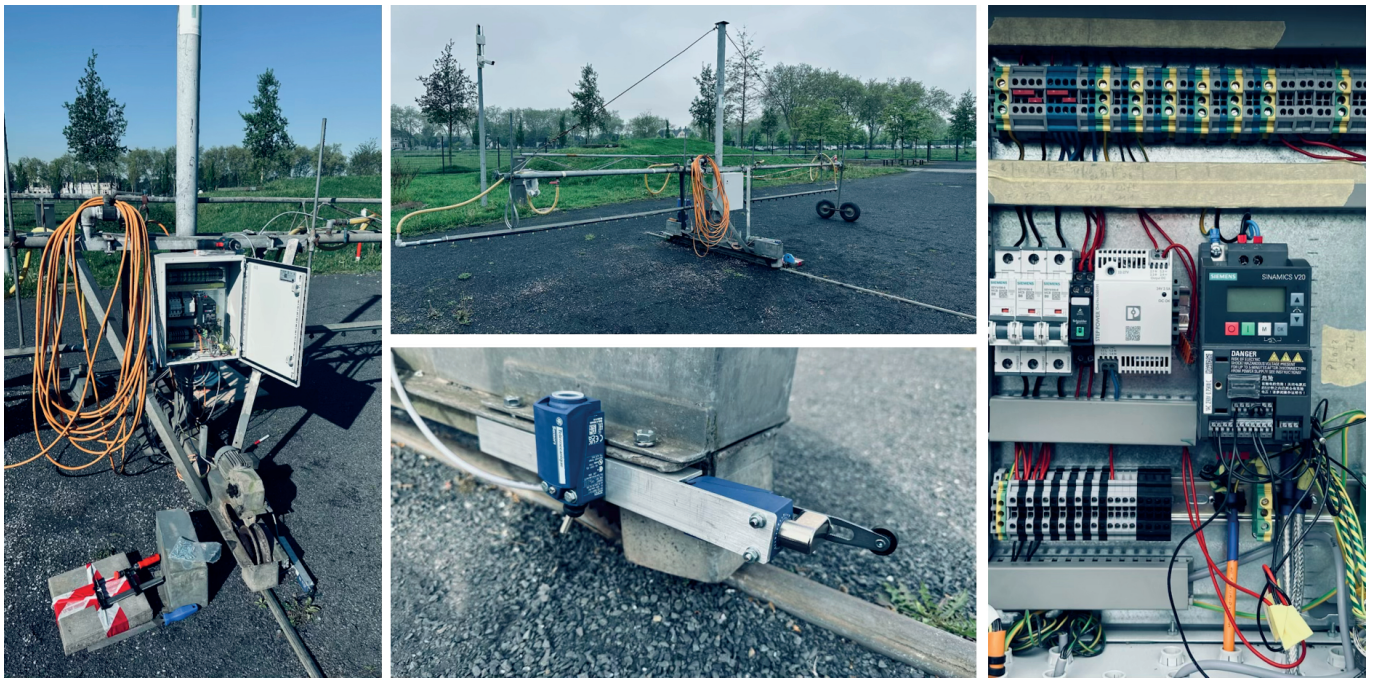
Fig. 1: Gießwagen im Greenfablab der HSRW