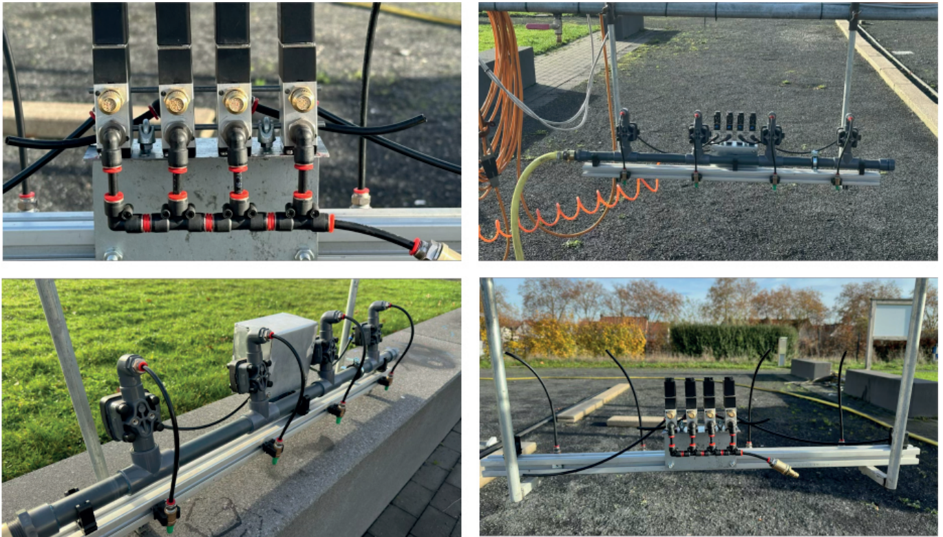
Fig. 5: Aufrüstung des Gießwagen mit einem Pneumatik Arm