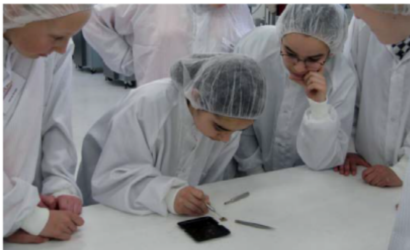
Mehr junge Menschen sollen durch das Projekt Duwetech für Technik interessiert werden.